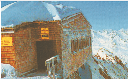
Berghütte in 3080 m Seehöhe seit 1994 mit Rezyrit - Pfanne gedeckt

Zur Auswahl stehen die vier Grundfarben ziegelrot, rotbraun, hellgrau und anthrazit sowie die Sonderfarben ziegelrot-antik, grün und blau. Als Sonderanfertigung ist auch jede beliebige Farbe mittels Aufpreis denkbar.